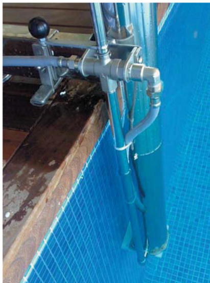
Apoyo interior PK