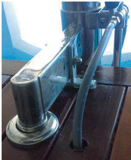
Detalle de toma de Agua